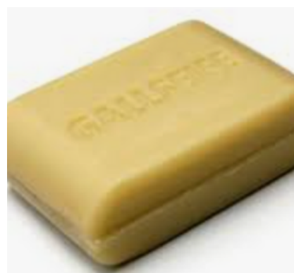
fest oder flüssig

Gallseife ist ein Seifenprodukt aus Kernseife und Rindergalle. Sie ist als flüssiges oder festes Endprodukt erhältlich.