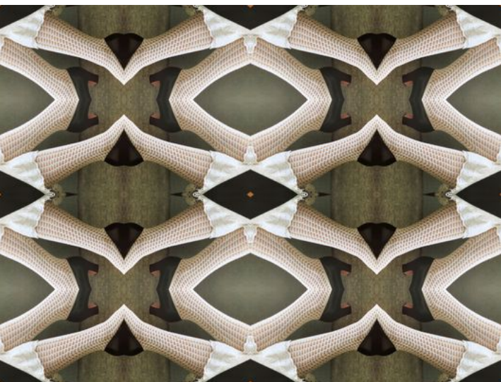
Eines der verschiedenen Tapeten-Vlies-Sujets.

Für das Projekt wurden klassische Trachtenelemente mit Designs der Studierenden aus Tapeten-Vlies, kombiniert: eine Fusion von Alt und Neu. Das Tapeten-Vlies ist mit traditionellen Mustern bedruckt. Es wurde von Lilla Wicki (Dozentin an der STF) entworfen und beim Schweizer Unternehmen Wirz-Tapeten produziert. Dieser Ansatz soll die Schönheit der Trachten anerkennen und unterstreicht zugleich die persönlichen Identitäten, Ideen und Werte der Studierenden. Die Exponate der Studierenden werden an der Ausstellung den traditionellen Trachten gegenübergestellt und eröffnen so den Dialog zwischen den Werken.