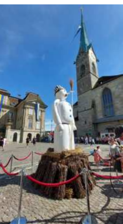
Kinderumzug Sechseläuten 2024

5. - 7. Schweizerische Trachtenvereinigung – Fédération nationale des costumes suisses: Schweizerisches Trachtenchorfest in Sursee – Chorales suisses en costume à Sursee, Auskunft: 055 263 15 63 oder info@trachtenvereinigung.ch