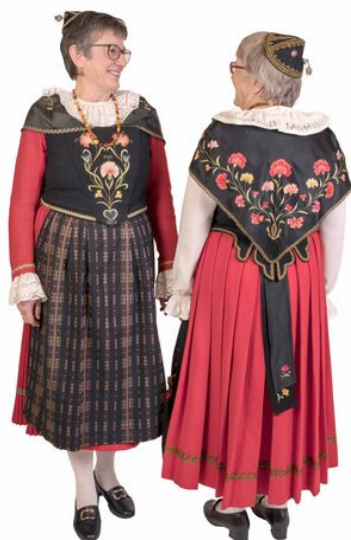
Unterengadin mit Münstertaler Schürze

nach dem Halsumfang der Trägerin. Bei einer Faltenbreite von 2 – 2,5 cm, ergibt es ungefähr 17 Falten. Es ist jedoch auch gestattet, dass die Murinella angezögelt wird.