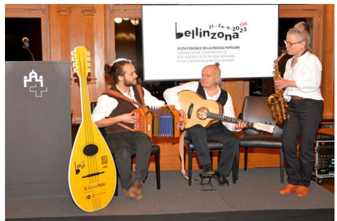
Bilder: Stefan Schwarz