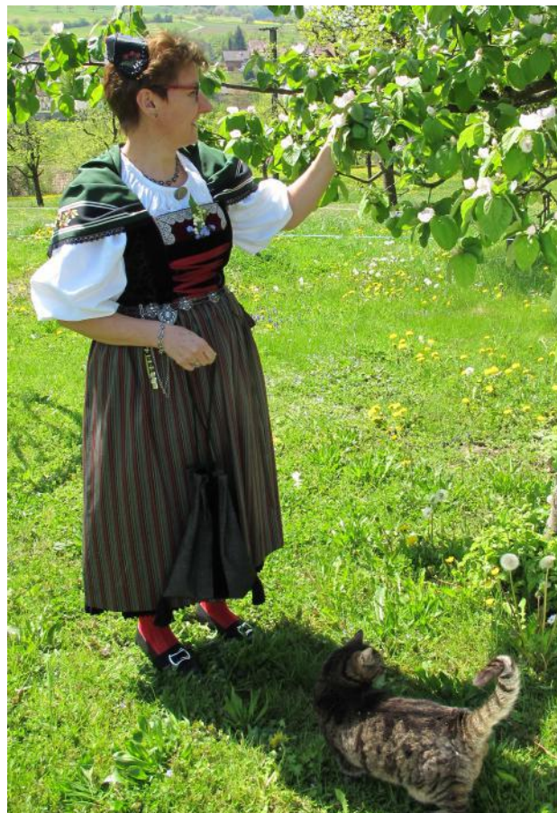
D Baselbietertracht (Lied 1. und 2. Strophe)

Si isch nit rych und überlade mit Silber und mit Schtickereie aller Art, doch isch si eben-au grad dorum so schön und e so apart.