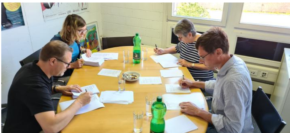
Comptage des bulletins de vote au bureau

Rapport: Denise Hintermann et Johannes Schmid-Kunz